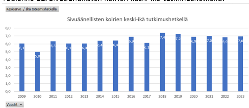
Taulukko 11. Sivuäänellisten koirien keski-ikä tutkimushetkellä.